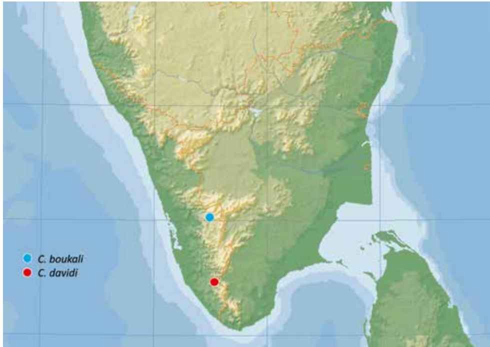
Fig. 3: Geographical distribution of Copelatus boukali and C. davidi .